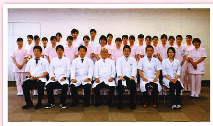
新入職員一同 よろしく申し上げます！

花の香りがそよ風に運ばれてくる候となりました。私たちは、晴れて庄原赤十字病院の新入社員としてスタートできる喜びを、この上なく光栄に思うと共に社会人としての責任の重さを感じております。庄原赤十字病院の理念である人道・博愛・奉仕の赤十字精神にのっとり、地域に根付いた看護を提供するために患者様一人一人に寄り添い、学ぶ姿勢を忘れず日々精進いたします。院内で行われる研修や日々