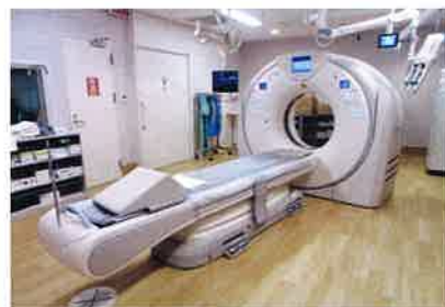
コンピュータX線断層診断システム (80列マルチスライスCT Aquilion PrimeSP i Edition)

今まで以上に交通事故患者などの救急医療体制の充実が図られ、地域医療へ役立てて参ります。