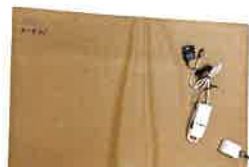
たためる薄型マット太君 ワイヤレスセット5台