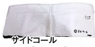
サイドコール ケーブルタイプ10台