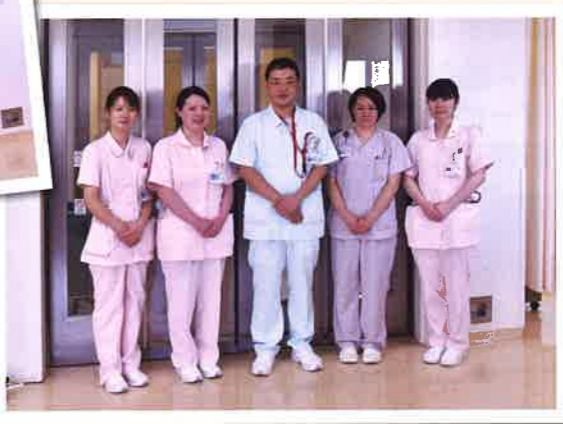
集中治療室(ICU)スタッフ

離床に焦点を当てた援助も行っており、人工呼吸器を装着された方でも日中はリハビリを頑張られており、中には歩行される方もおられます。私たちは、患者様が元々生活されてきた場所に退院されるよう、スタッフ全員でサポートしています。