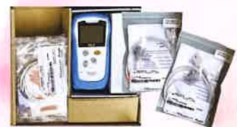
パルスオキシメーター (乳児センサー)2台