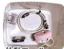
体動ボール 「うーご君」10台