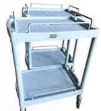
クラシック カート15台