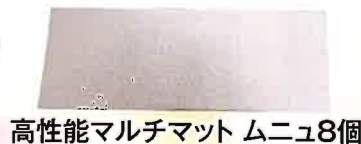
高性能マルチマット ムニュ8個