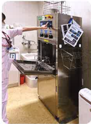
ベッドパンウォッシャー1台

◆日本財団より『新型コロナウイルス感染症対策整備 支援事業』としてHEPAフィルター付きクリーンパーテーションやベッドパンウォッシャーをはじめ 下記の感染症対策資機材等の整備支援をしていただきました。