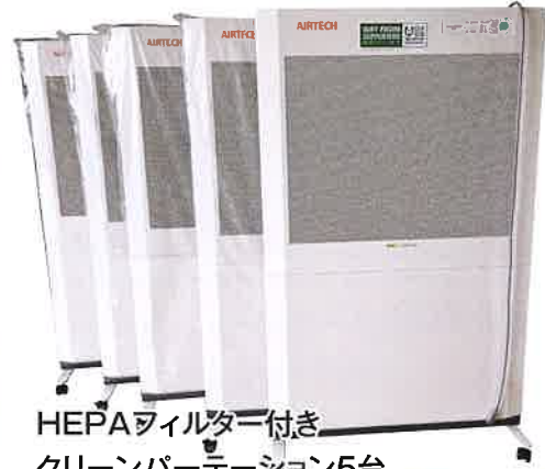
HEPAフィルター付き クリーンパーテーション5台