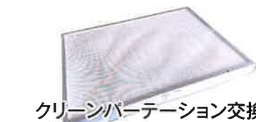
クリーンパーテーション交換用 HEPAフィルター5枚