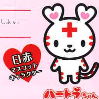
日赤 マスコット キャラクター