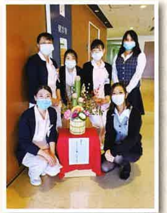
社会課スタッフ一同

今後も受診者さんの健康維持・増進をお手伝いできるよう、ご本人に寄り添った関わりを心がけていきたいと思ひます。