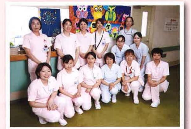
南2病棟スタッフ一同