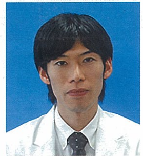
総合診療科副部長

11月となり朝晩めっきりと寒くなりました。院内でもマスク姿が目立ち始め、感冒症状や嘔吐・下痢症状で受診される方々も増えている印象です。最近では年中なにかしらの感染症が流行している印象がありますが、冬季に関して言えば、例年「インフルエンザ」と「感染性胃腸炎」が2大流行性疾患としてあげられるのではないのでしょうか。