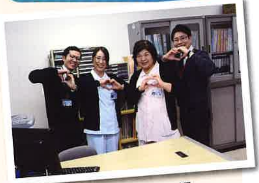
相談員スタッフ一同