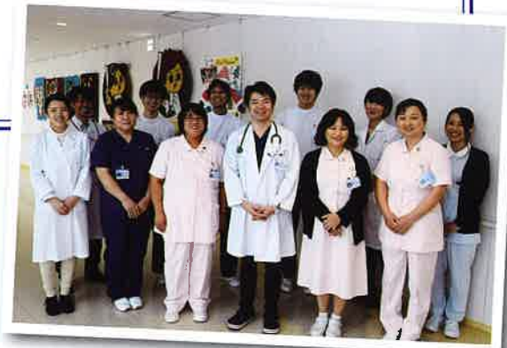
心臓リハビリチーム

このような効果があるとされていますが、心臓リハビリを通して患者さんが自身の病気を理解し、知識を深め、その病気と向き合っていくことが出来るようになることも大切です。