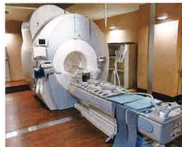
EXCELART Vantage Atlas-X 1.5T (東芝製)

MRI 検査は我慢していただくことも多いですが、非常に有用な検査です。使い捨ての耳栓も用意しておりますので、騒音が気になる方はお申し出ください。