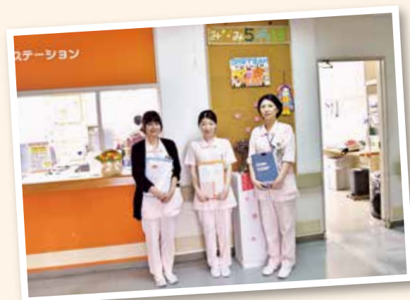
南5階病棟スタッフ

これからもこのような取り組みを続けていき、再入院予防につなげていきたいと思えます。